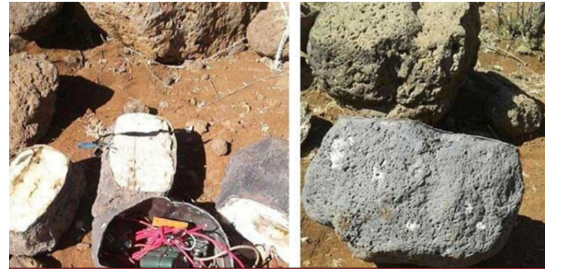
إحدى العبوات الناسفة تم اكتشافها قبل التفجير

وأشار التقرير إلى قوات الأسد لجأت إلى تنفيذ تلك العمليات بالاستعانة ببعض عملائها المأجورين أو عن طريق عناصر تسلمت لتلك النقاط، حيث قام الإعلام الحربي ونشر الفيديوهات بشكل رسمي. و أوضح التقرير أن خلايا تابعة لجيش خالد بن الوليد المباع لتنظيم الدولة كان وراء بعض اغتيالات أخرى، وخاصة تلك التي حدثت قرب مقرات عسكرية أو بيوت قيادات ثورية، وذلك باعتراف بعض